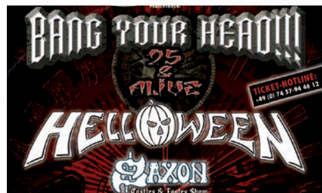
BANG YOUR HEAD 2023 - Festivalticket 13.07. – 15.07., Messegelände Balingen

Für Abonnenten 16,50 € – 23,40 € statt 18,50 – 26,00 €