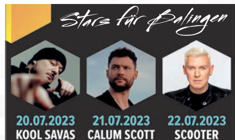
20.07.2023 Kool Savas 21.07.2023 Calum Scott 22.07.2023 Scooter

Kool Savas, Calum Scott, Scooter, 20.07. – 23.07., Marktplatz Open Air Balingen