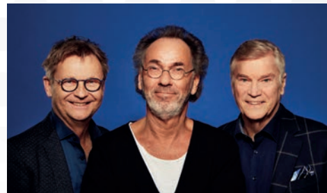
Komplexe Väter – Komödie, 27.04. Stadthalle Balingen

31.03. Tina – The Rock-Legend – The Ultimate Tribute, Zollern-Alb-Halle Tailfingen, wurde ersatzlos abgesagt The Show – A Tribute to ABBA, Porsche-Arena Stuttgart, verschoben auf 10.05.23 Frei.Wild, Schleyerhalle Stuttgart, verschoben auf 26.05.23