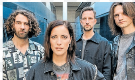
Silbermond, 23.07., Marktplatz Open Air Balingen

Für Abonnenten 48,75 – 59,25 statt 51,75 – 73,95 €