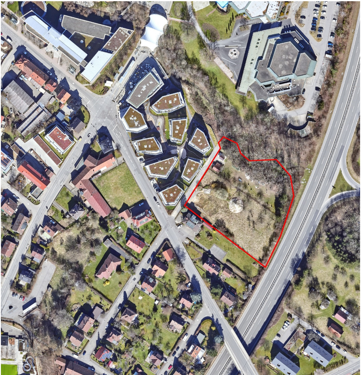
Abbildung 2 Untersuchungsgebiet (rot umgrenzt, Luftbild Stand März 2023)

Das Plangebiet befindet sich im Ortskern von Balingen. Es umfasst eine Wiese mit einzelnen Obstbäumen. Auf der Wiese befindet sich ein großes Erdloch und ein großer Erdhügel (hier befand sich bis zum Jahr 2021 noch ein Wohnhaus mit angrenzender Scheune). Am Etzelbach befinden sich überdies noch Gehölzbestände, ein Schuppen und eine Trafostation.