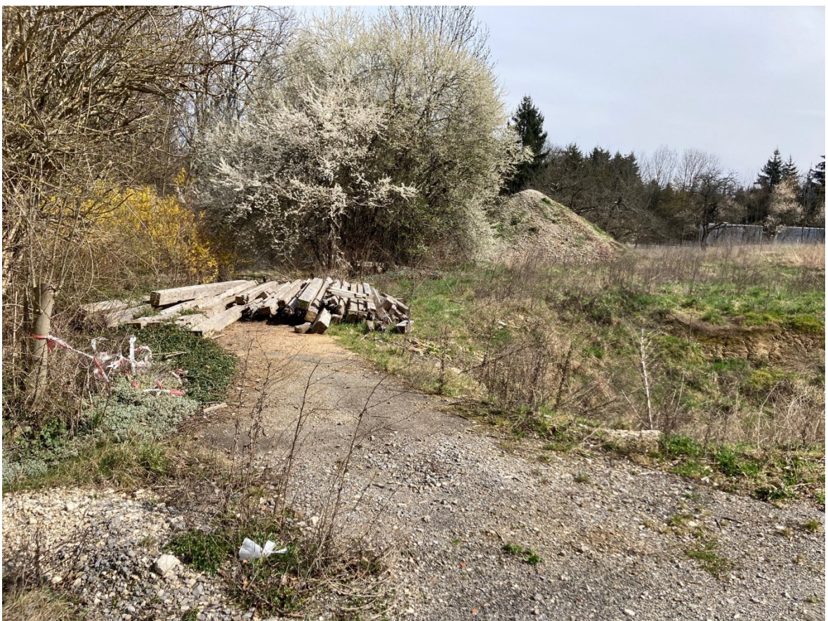
Abbildungen 3 – 4 Plangebiet Stand 28.03.2023