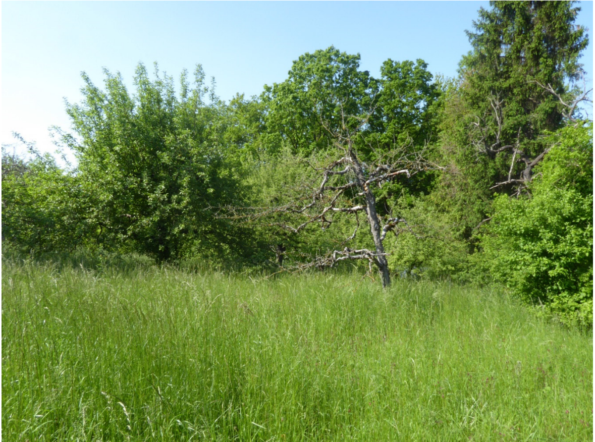
Abbildung 8 Obstbaumbestand mit abgängigem Baum, ohne Hinweis auf Fledermäuse

Eine Inspektion des Holzschuppens am Etzelbach sowie der Obstbäume im Plangebiet ergab keinen Hinweis auf eine Quartiernutzung durch Fledermäuse. Einzelne abgängige Obstbäume wiesen keine für Fledermäuse nutzbare Strukturen auf. Aus den Ausflugbeobachtungen und anschließenden Detektorbegehungen ergaben sich ebenfalls keine Hinweise auf eine Quartiernutzung im Plangebiet.