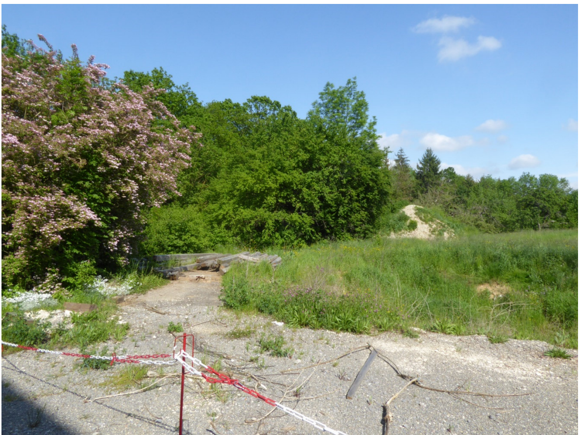
Abbildungen 5 – 6 Plangebiet Stand 25.05.2023