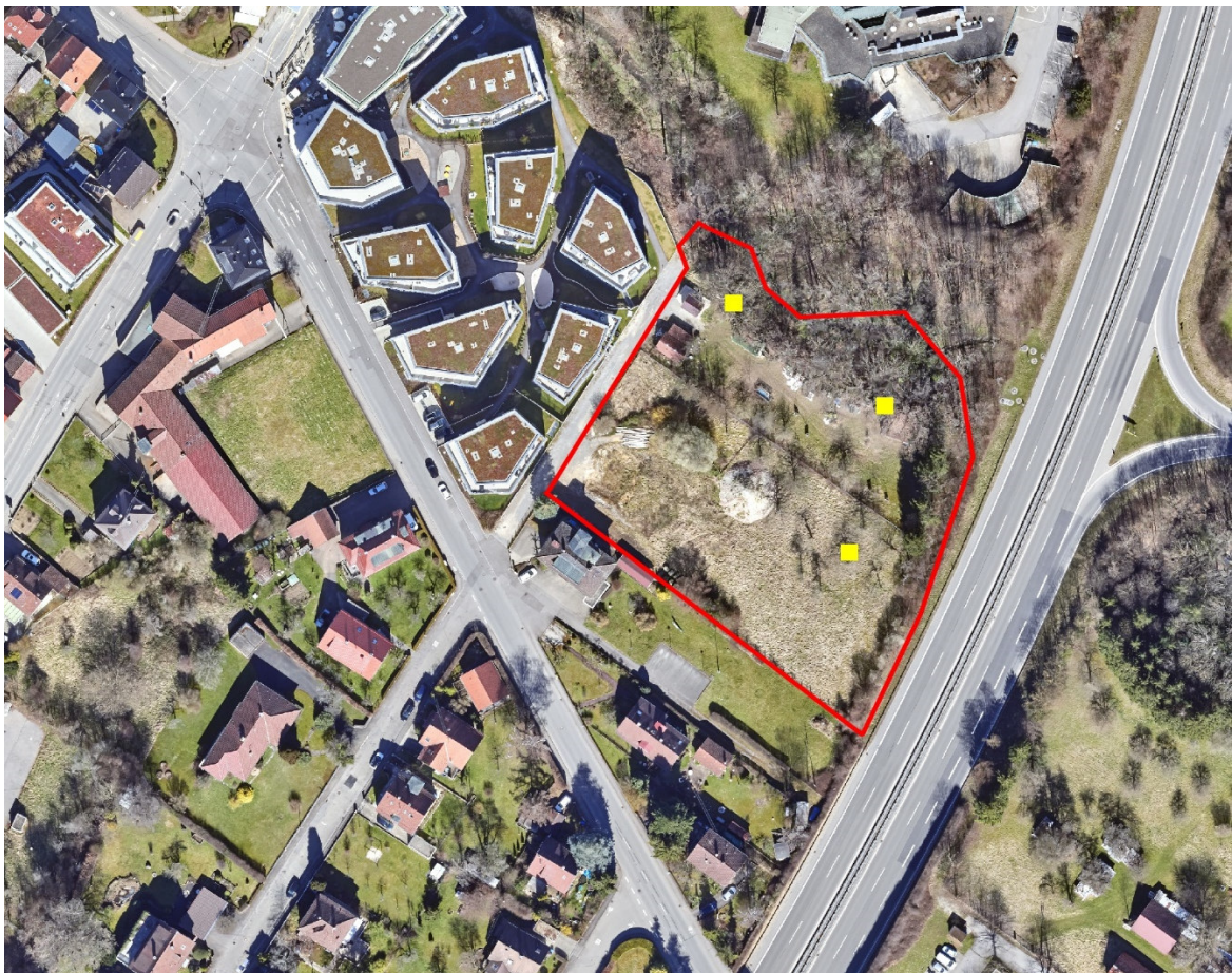
Abbildung 7 Batlogger-Standorte (gelb)

Im Hinblick auf das Quartierpotenzial erfolgte zunächst eine Übersichtserfassung am 24.04.2023. Am 25.05., 24.06. und 22.08.2023 wurden alle erreichbaren Unterschlupfmöglichkeiten im Plangebiet mit dem Endoskop inspiziert, darüber hinaus wurde in dem kleinen Holzschuppen am Etzelbach auch nach indirekten Spuren (Kotpellets, verfärbte Hangplätze, Mumien, Fraßreste) gesucht. Am Abend erfolgten jeweils Ausflugbeobachtungen mit anschließenden Detektorbegehungen. Alle Detektorbegehungen wurde bei geeigneten Witterungsbedingungen ( > 10^{\circ}\text{C} , niederschlagsfrei, windarme Verhältnisse) durchgeführt. Darüber hinaus wurde ein Batlogger A+ (Elekon, CH) zur automatischen Erfassung von Fledermausrufen installiert. Der Batlogger zeichnete vom 25.05. – 02.06., 24.06. – 01.07. und vom 22.08. – 29.08.2023 jeweils in der ersten Nachthälfte (Hauptaktivitätsphase der Fledermäuse) durchgehend auf. Die Lautaufnahmen und Sonagramme wurden am PC mit Hilfe der Programme BatExplorer und BatSound analysiert.